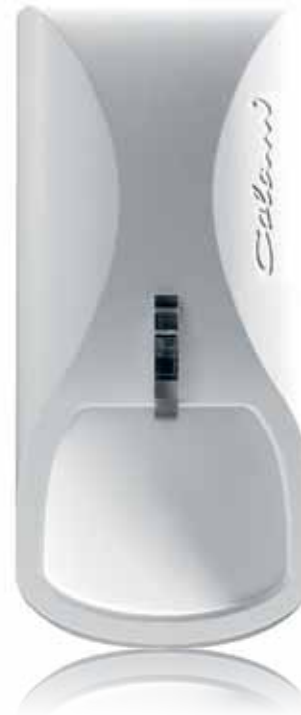
Das Gehäuse des Bewegungsmelders comstar stammt von Designer Luigi Colani.